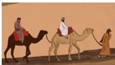
شکل ۹-۲: مقوله سطح فرودست حرف «فی»

مثال‌های (۸) و (۹) نیز متفاوت به نظر می‌رسند. بیکربندی فضایی در هر دو شبیه است(شکل‌های ۹-۱ و ۹-۲)، با وجود این تفاوتی در اینکه کاربر زبان چگونه رابطه میان دو هستی را شناسایی می‌کند، وجود دارد.