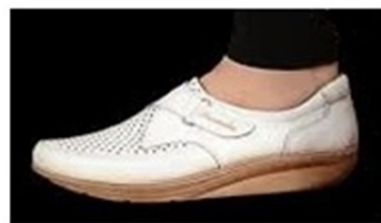
شکل ۹-۱: مقوله سطح پایه حرف «فی»

در (۸) آدمی و روز رستاخیز با یک ریسمان به یکدیگر مربوط شده‌اند بسان دو شتری که با قَرَن «رسنی که با آن شتران را بندند»(فراهیدی، ۱۴۰۹ق: ۱۴۲/۵) آن دو را به یکدیگر بسته‌اند و کاملاً به یکدیگر نزدیک هستند(شکل ۹-۲).