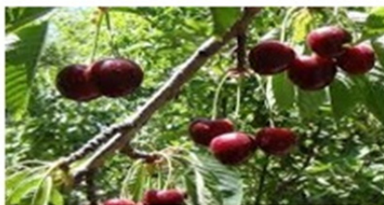
شکل ۵: مقوله سطح فرودست حرف اضافه «بی»

در (۴) برای مفهوم‌سازی درخت و شاخه‌های نازک و کلفت آن به‌عنوان ظرف، باید آن را یک جسم سه‌بعدی تعبیر کرد که مرزهای آن توسط انتهای شاخه‌ها تعریف می‌شود (شکل ۵).