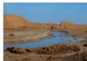
شکل ۸: مقوله سطح فرودست حرف اضافه «فی»

مثال‌های (۸) و (۹) نیز متفاوت به نظر می‌رسند. بیکربندی فضایی در هر دو شبیه است(شکل‌های ۹-۱ و ۹-۲)، با وجود این تفاوتی در اینکه کاربر زبان چگونه رابطه میان دو هستی را شناسایی می‌کند، وجود دارد.