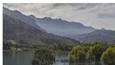
شکل ۶-۱: مقوله سطح فرودست حرف «بی»

مثال‌های (۶) و (۷) نکته نسبتاً متفاوتی را نشان می‌دهند؛ یعنی این واقعیت که مفهوم خود «ظرف» میزان معینی از انعطاف‌پذیری را نشان می‌دهد. مثال (۶) همچون مثال (۱)، یک مورد