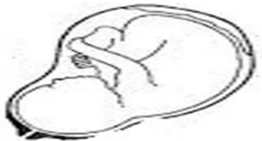
شکل ۲: مقوله سطح پایه حرف اضافه «فی»

توسط زمینه (زمین) احاطه می‌شود و در داخل آن محصور است (شکل ۲).