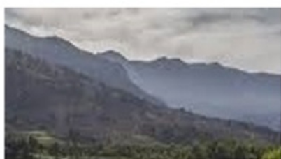
شکل ۶-۲: مقوله سطح فرودست حرف «بی»

در (۵) این پرسش که آیا کوه‌ها در گوشه مرزنا هستند، با توجه به ماهیت نامشخص «گوشه»، یک موضوع کاملاً بد-تعریف است. این پرسش می‌تواند تحت تأثیر حضور اجسام دیگر در صحنه واقع شود؛ با احتمال زیاد سخنگو، کوه نمودار سمت راست شکل ۶-۱ را در مقایسه با کوه نمودار سمت چپ ۶-۲، در گوشه فرض می‌کند ولو اینکه موقعیت کوه در هر دو یکسان است.