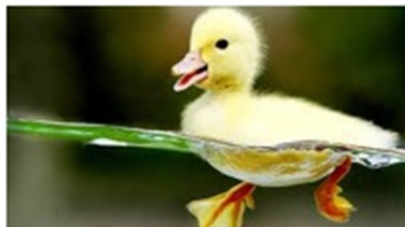
شکل ۴: مقوله سطح فرودست حرف اضافه «بی»

در (۴) برای مفهوم‌سازی درخت و شاخه‌های نازک و کلفت آن به‌عنوان ظرف، باید آن را یک جسم سه‌بعدی تعبیر کرد که مرزهای آن توسط انتهای شاخه‌ها تعریف می‌شود (شکل ۵).