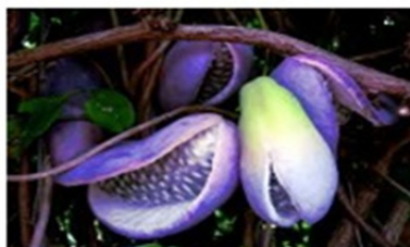
شکل ۷: پیش‌نمونه حرف اضافهٔ «فی»

پیش‌نمونه از مفهوم است که در آن یک هستی سه‌بعدی (میوه) کاملاً محصور در محدوده‌های یک ظرف سه‌بعدی است که آن را از همه طرف فرا می‌گیرد (شکل ۷).