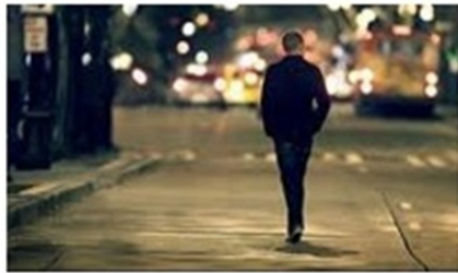
شکل ۱۲: روی جاده

حاوی دیدگاه دانه‌درشت (coarse-grained) است؛ این دیدگاه مفهوم شریعت را یک خط / سطح دوبعدی مفهوم‌سازی می‌کند که مسیری برای حرکت است و عمق آن دیده نمی‌شود (شکل ۱۲).