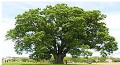
شکل ۳: مقولهٔ سطح فرودست حرف اضافهٔ «فی»

شایان ذکر اینکه سایهٔ درختان، در مقایسه با شکم مادر، یک مقولهٔ سطح فرودست به‌شمار می‌آید. به‌عبارت دیگر، یک مثال کم‌تر پیش‌نمونه از شکم مادر است، زیرا از طرفین چندان مرز روشنی ندارد. با وجود این از یک مرز خیالی برخوردار است؛ چون اگر مسیریما در محدودهٔ نسبتاً میانی سایهٔ مرزنا باشد، می‌تواند «در» سایه باشد، اما به آنچه مسیریما در محدودهٔ کمی دورتر از طرفین مرزنا واقع شود، «در» سایه اطلاق نمی‌شود، بلکه گوینده تعبیر «انسان زیر درخت» را به‌کار می‌برد نه «انسان زیر سایه». براین اساس پیشاپیش می‌توان در این مثال، نمونهٔ متفاوتی از مفهوم مرکزی «فی» (ظرفیت) را مشاهده کرد. به بیان عینی‌تر، سایه یک ظرف سه‌بعدی خوش-تعریف نیست، اما در کاربرد روزمره واژه‌ای همچون در سایه، یک ظرف تعبیر می‌شود.