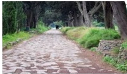
شکل ۱۱: در جاده

تعبیر یک شیء با تنظیم دانه‌بندی عددوار (اسکالر) جنبه‌ای از عملیات توجه است. کار بست حرف اضافه «فی» در عبارت فوق، نسبت به حرف اضافه «علی» مقیاس دانه‌ریزتری را فرامی‌خواند و از دعوت امام (ع) به حرکت دائمی در مسیر صحیح شریعت حکایت دارد.