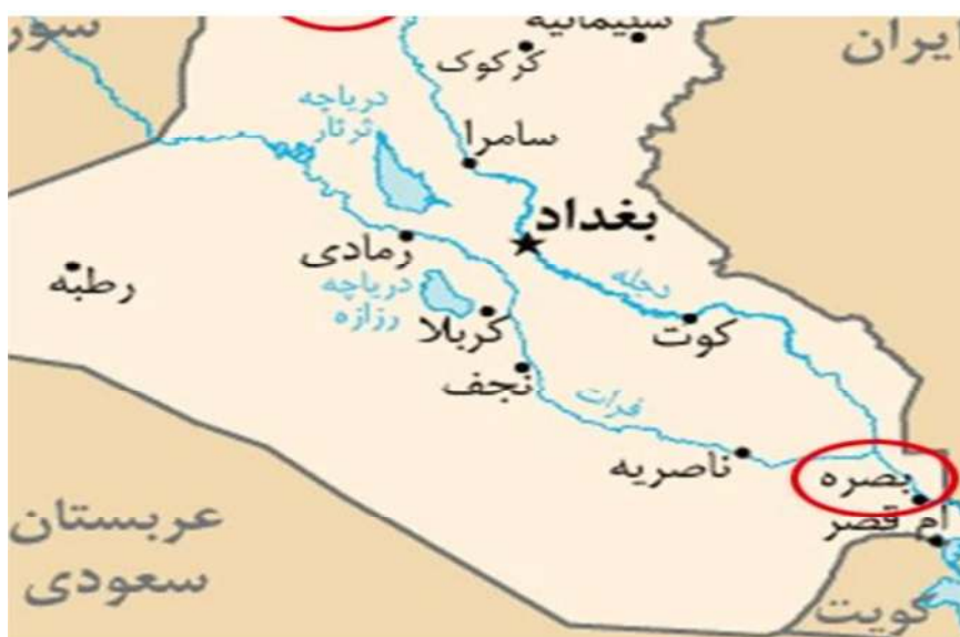
نقشه شماره ۱- موقعیت جغرافیایی بصره

بدیهی است که تأثیر موارد ذکر شده در حد فراهم آوردن بخشی از زمینه و بستر انحراف بصریان بوده است و هرگز علت تامه در عملکرد ساکنان آن نیست. اگرچه در جنگ جمل جمعیت کثیری از ساکنین بصره به حمایت از ناکثین پرداختند و یا از جنگ کناره‌گیری کردند و به یاری حضرت علی(ع) پرداختند؛ اما در میان آن‌ها تعداد اندکی هم بودند که به حمایت از آن امام همام(ع) برخاستند. این موضوع نشان می‌دهد که حتی در محیط نامناسب طبیعی و اجتماعی هم می‌توان در مسیر حق حرکت کرد و تأثیرات سوء عوامل طبیعی و اجتماعی را خنثی نمود.